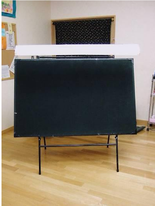
パネルスタンド（市販）