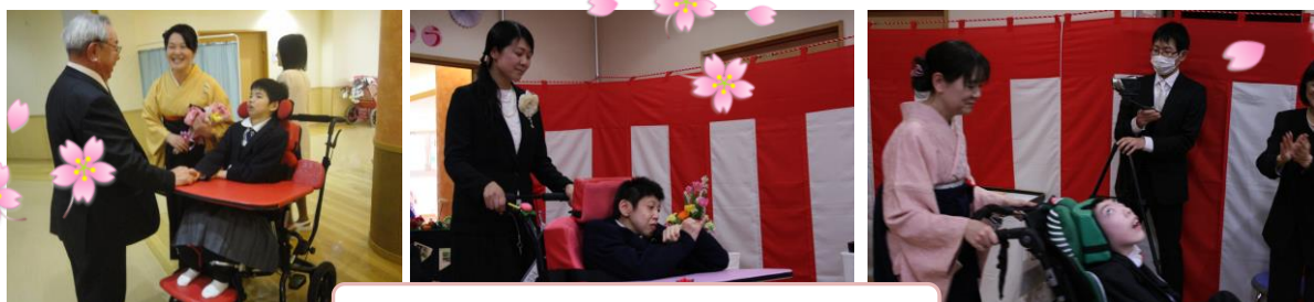
温かい拍手にて、包まれて入場しました。