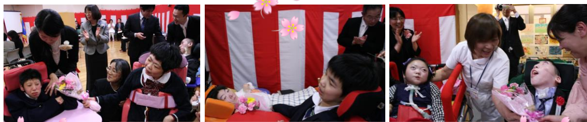
在校生のみなさんが、花束を手渡し、見送ってくれました。