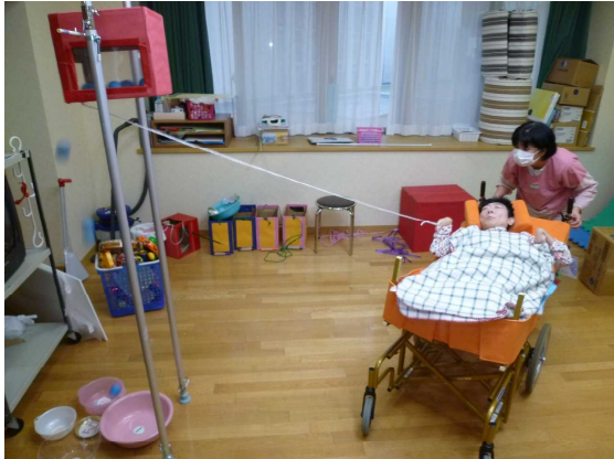
支柱を立ててダイナミックに