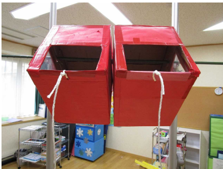
「ころぼんマシン」2連