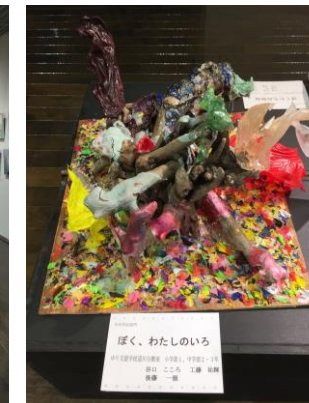
「ぼく、わたしのいろ」