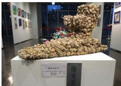
優秀賞→ 「丘の上から」