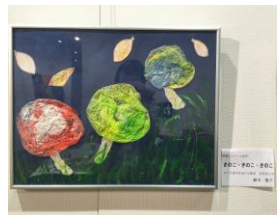
「きのこ・きのこ・きのこ」