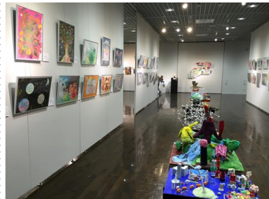
わくわく美術展の様子