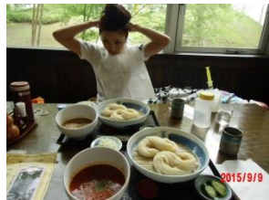
稲庭うどん、おいしそう・・・私はいつもの昼ごはん。