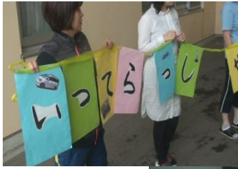
先生たちが見送ってくれました。

9月9日（水曜日）中学部3年生は、秋田ふるさと村に修学旅行に行ってきました。ちょっぴり曇り空でしたが、雨に降られることもなく、心地よい秋の1日を楽しんできました。ふるさと村では、秋風に吹かれながら乗り物に揺られ、魔法の美術館（企画展）で音と光の不思議な世界にたっぷりとひたってきました。生徒も保護者も引率者もたくさんたくさん笑いました。何度思い返しても楽しい1日でした。