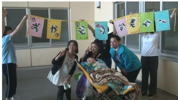
到着式。親切なタクシーの運転手さん、安全運 転ありがとうございました。