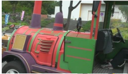
のんびり走る チューチュー トレイン。