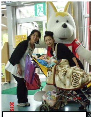
ノブ君と一緒に 記念撮影。