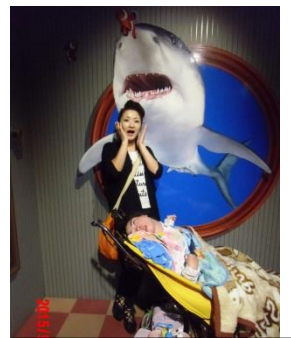
親子でポーズ決めて みました。