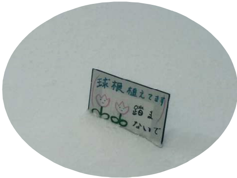
【冬のチューリップ花壇】