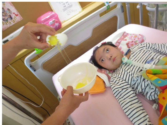
卵のおもちゃとスライムで疑似体験