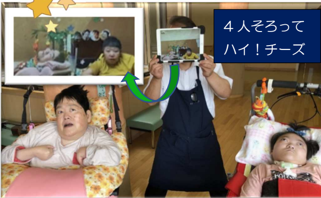
4人そろって ハイ！チーズ

新型コロナウイルスの感染予防のため、タブレットで中継しながらの七夕会になりました。短冊には、「家族に会いたい」「みんなと会って勉強したい」「お散歩に行きたい」などの願い事が書かれていました。一人ずつ願い事を発表したり「たなばたさま」の歌を歌ったりしながら、季節を感じるひとときとなりました。