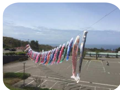
【たなびく大きな鯉のぼり】