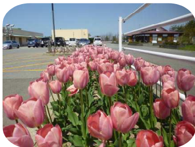
【チューリップ花壇】